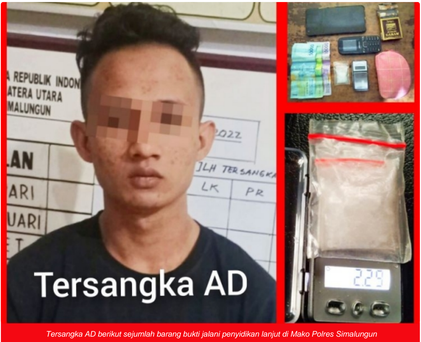
Tersangka AD berikut sejumlah barang bukti jalani penyidikan lanjut di Mako Polres Simalungun

SIMALUNGUN - Pemberantasan peredaran narkoba dan penindakan tegas terhadap pelakunya, merupakan prioritas utama dan juga wujud komitmen Satuan Narkoba Polres Simalungun.